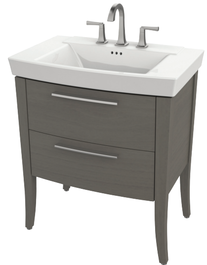
Dessus de colonne Townsend 0328008 illustrée avec meuble-lavabo 9036030 et poignées de tiroir 7760000

VOIR LES DIMENSIONS DE RACCORDEMENT AU VERSO