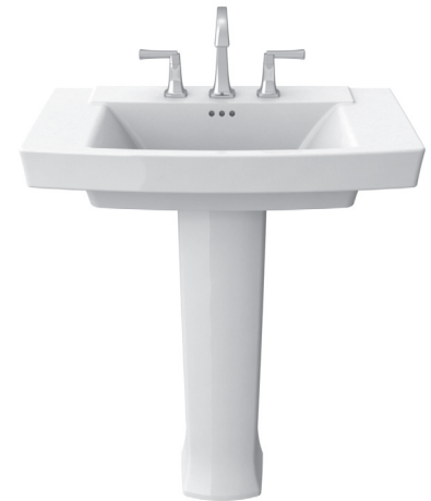
Lavabo sur colonne combiné Townsend 0328800