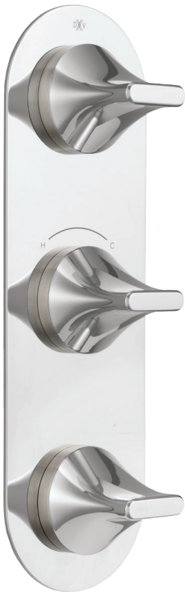
DIAGRAMME DE LA ROBINETTERIE AU VERSO